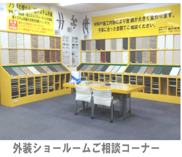
外装ショールームご相談コーナー