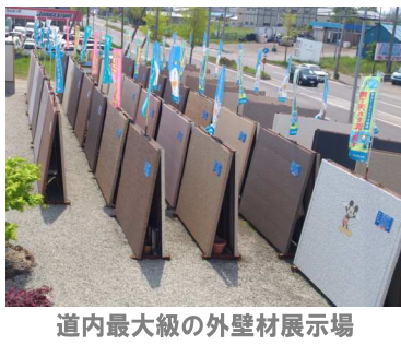
道内最大級の外壁材展示場