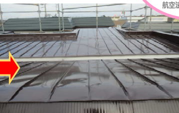
工事中（屋根塗装工事）