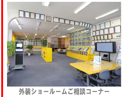
外装ショールームご相談コーナー