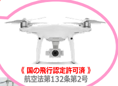
《国の飛行認定許可済》 航空法第132条第2号

お客様お立会いの上、現状映像をタブレットで確認しながら適切なアドバイスを致します。