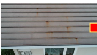
屋根診断→工事提案見積