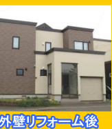
外壁リフォーム後

サイディング施工 シーリング施工 金具留め施工で美しい仕上がりに サッシ下には窓下水切りを取付