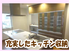
充実したキッチン収納