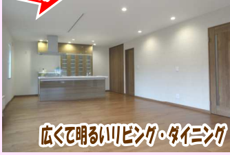
広くて明るいリビング・ダイニング