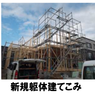
新規躯体建てこみ