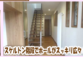
スケルトン階段でホールがスッキリ広々!