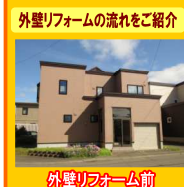
外壁リフォーム前

外壁を剥すからわかる、壁内の健康状態 当社こだわりの施工技術で健康住宅に生まれ変わります