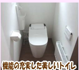
機能の充実した美しいトイレ