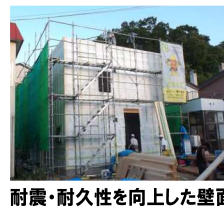
耐震・耐久性を向上した壁面