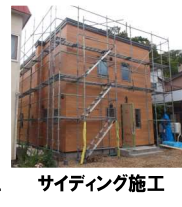
サイディング施工