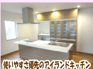
使いやすい優先のアイランドキッチン

玄関上の勾配屋根を無落雪屋根に変更。 窓がなく暗かった台所は位置を変えて明るい南側へ設置。 同じく窓のない暗い和室も洋室へ変更しています。 明るく広々と使えるオープンスペースを増やして 家族揃って集まれる場所を大きな窓を設置して明るい空間へ 水廻り等でも体に優しいスペースと使い勝手を重視。 年配の方から若い世代の方まで皆に優しい住まいのプラン をご提案しました。