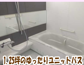
1.25坪のゆったりユニットバス