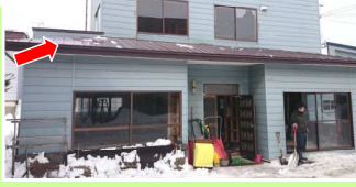
玄関上屋根からの落雪が怖い!